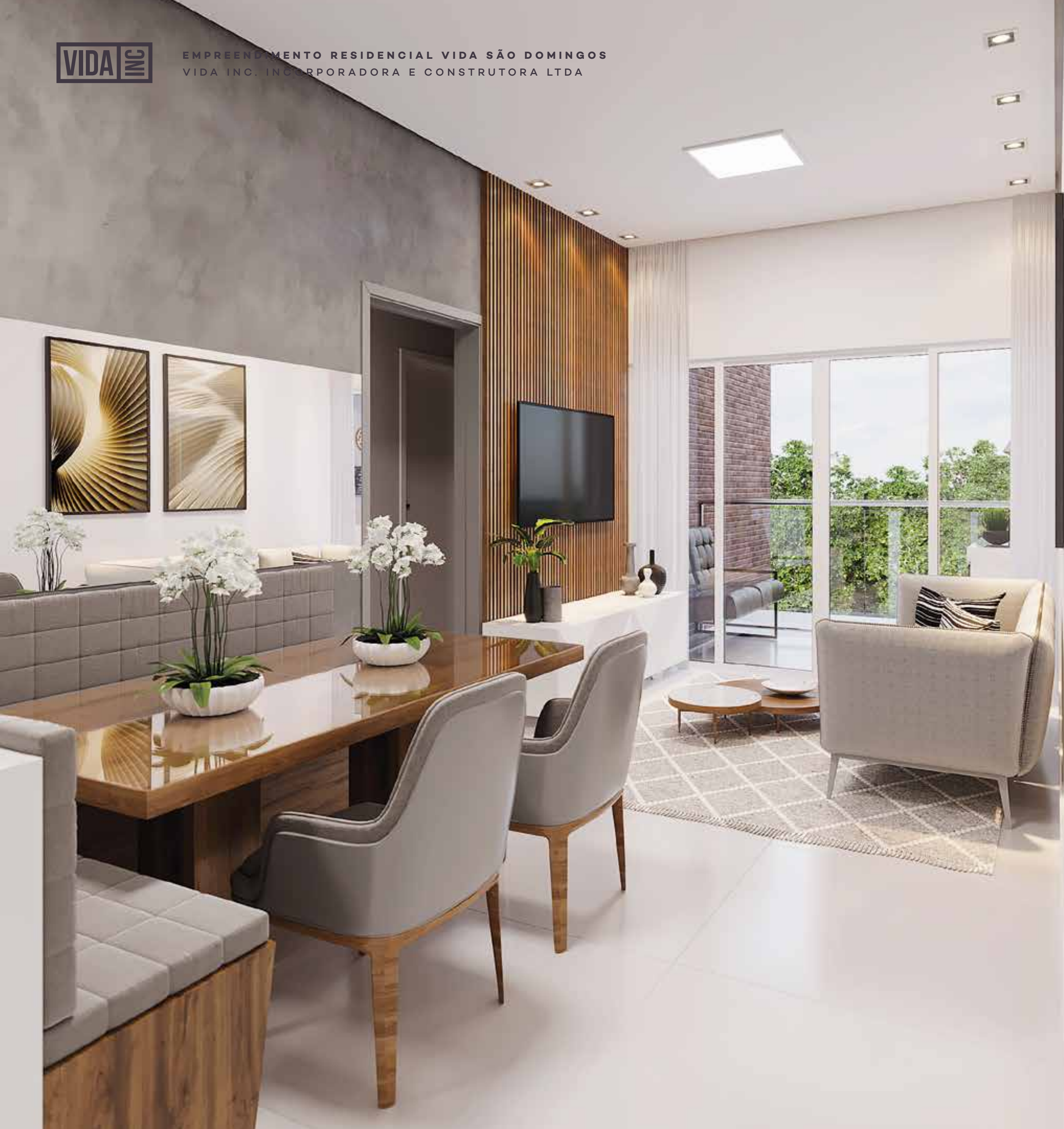
SALA 2 AMBIENTES