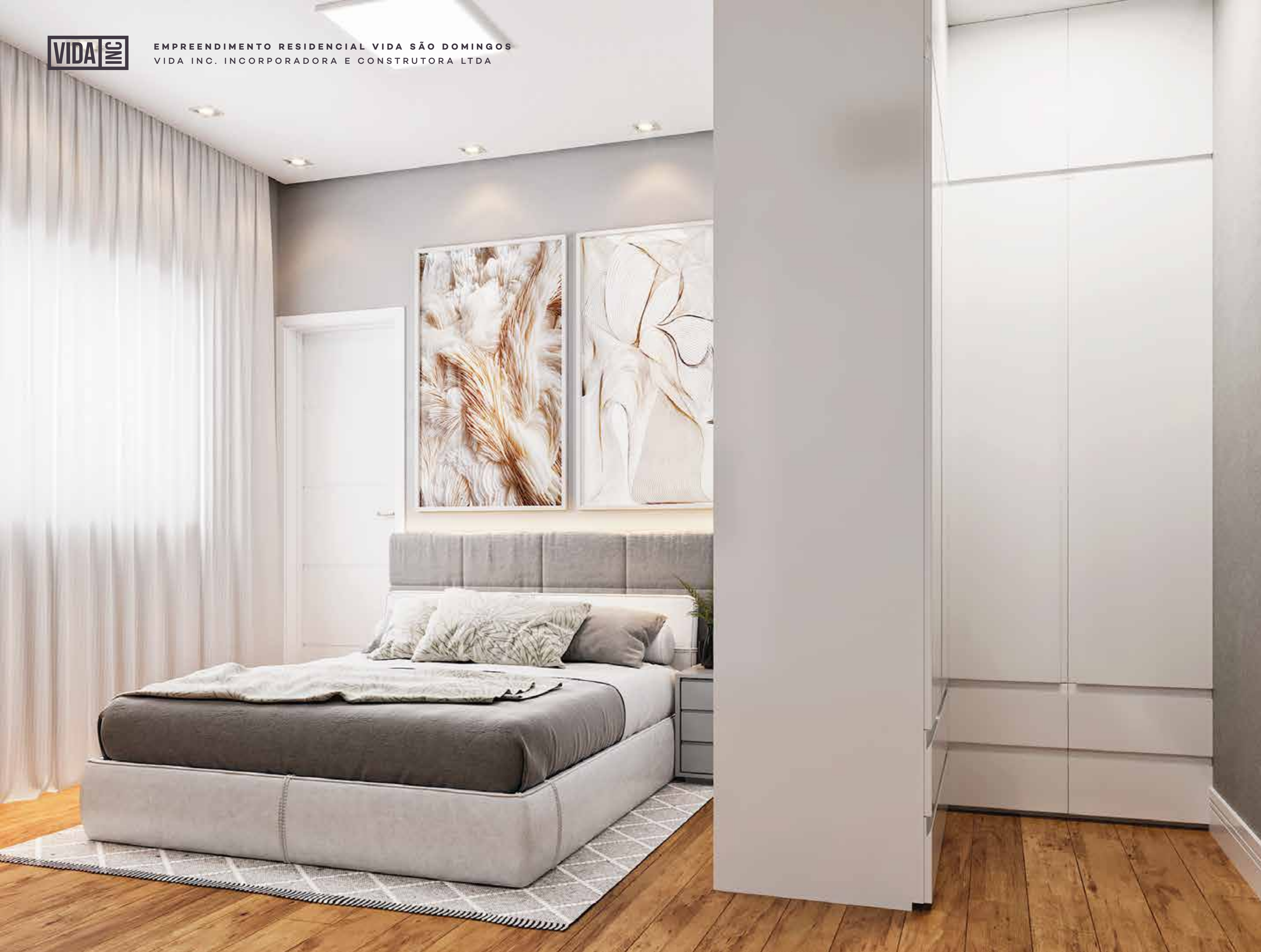
QUARTO 1 COM CLOSET E SUÍTE